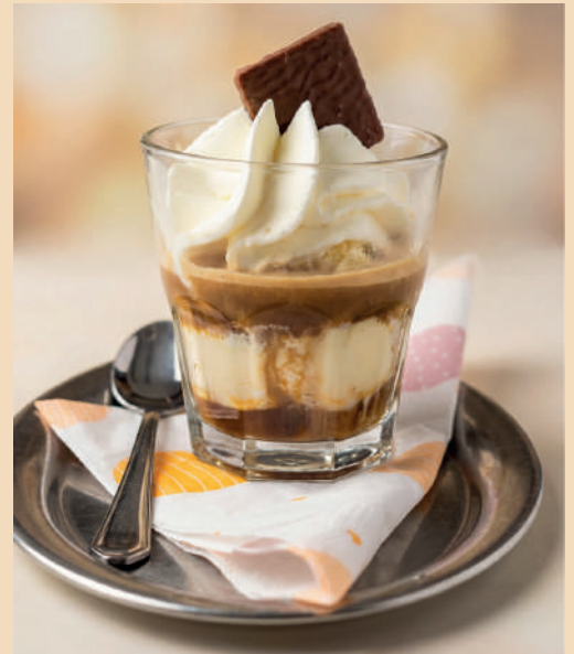
Affogato 4,50 €