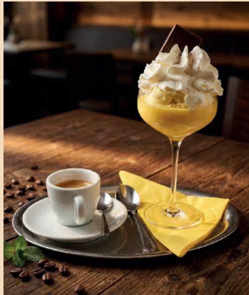
Vanilleeis 6,50 € mit Eierlikör, Sahne und Espresso