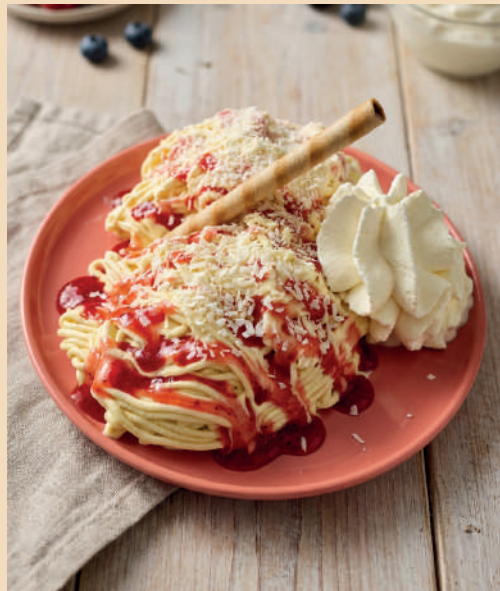
Spaghettieis 7,50 €